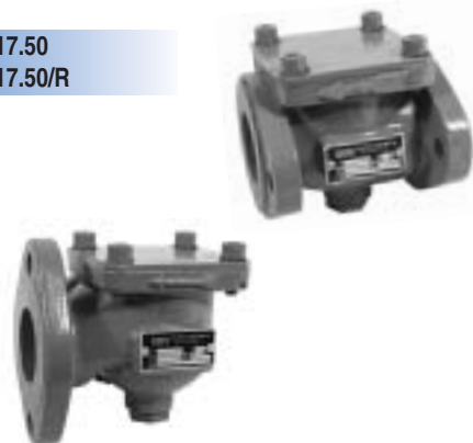
V 317.50 V 317.50/R

Zpětné ventily se používají jako zpětné uzavírací prvky pro pohonné hmoty (naftu, benzín, petrolej) ve vodorovné části potrubí.